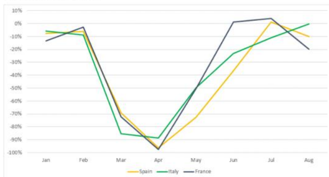
New-car registrations, France, Italy and Spain, year-on-year percentage change, January to August 2020

意大利汽车工业协会 ANFIA 的看法相对积极：“在经历 3 月到 7 月连续 5 个月的两位数跌幅后，8 月是意大利汽车市场今年以来第一次呈稳定趋势。”数据机构 ISTAT 的月度调研显示，8 月意大利消费者和企业信心指数均上升。